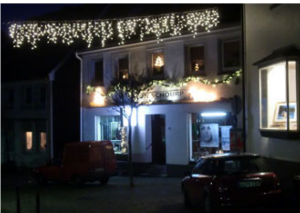
Bel. Auslagen weisen den Weg...