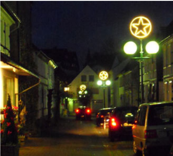
die Schulstraße zur Denkmalstr.