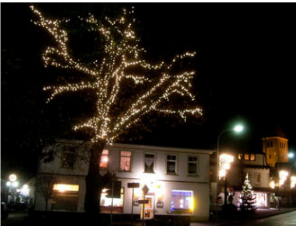
die Neue Straße mit Sternen...