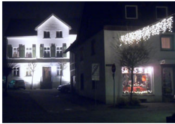
Haus Uferplatz ein Blickfang.....