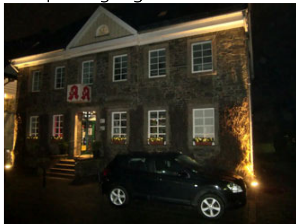
nicht nur zur Apotheke.....