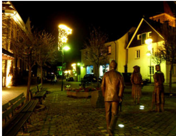
Ein Spaziergang lohnt sich.....