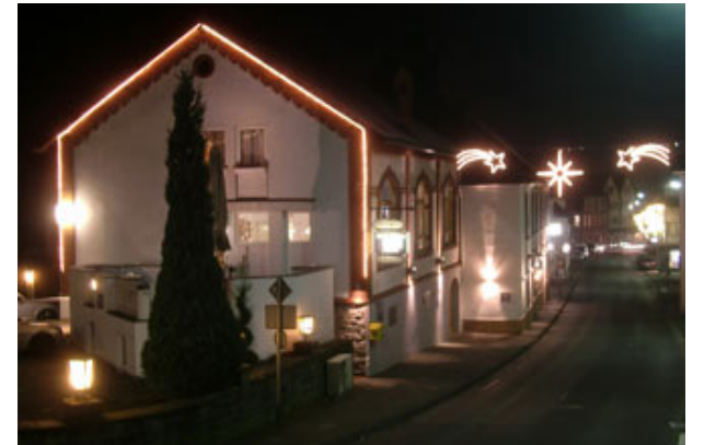
Eine stimmungsvolle Weihnacht..