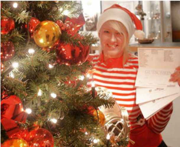
STM-Gutscheine zum Fest.....