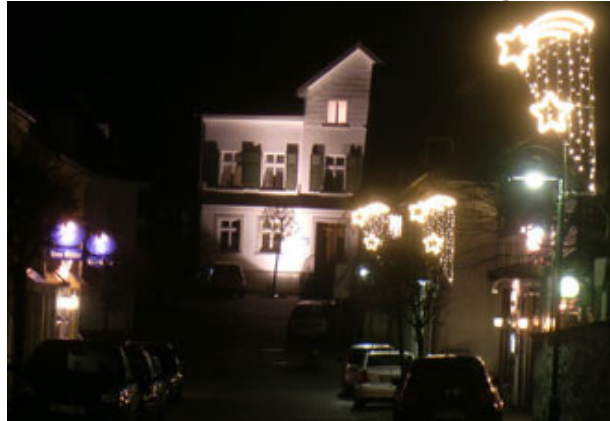
Denkmalstraße ist besuchenswert