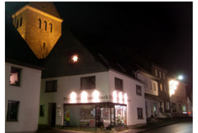
Ein Stück die Frankfurter rauf.....