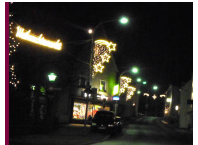
und weitere Lichtblicke zeigen....