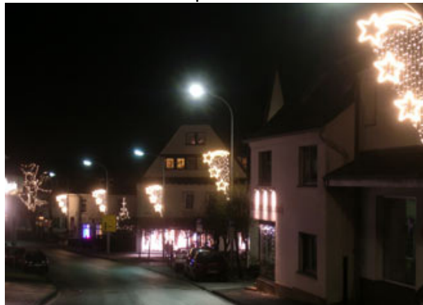
Auch die Frankfurter hat's..... Sowohl rauf als auch runter in dekorativer Lichtgestaltung.....