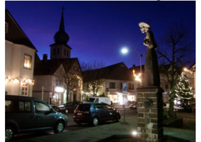
erhellte Fassaden und Geschäfte.